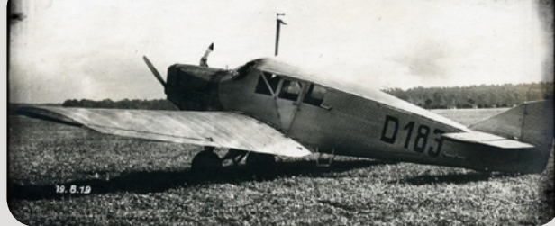
Юнкерс F-13 - прототип

Рекламната листовка на БУНАВАД, която виждате, ни дава подробна потребителска информация. Компанията предлага пътнически и пощенско-товарни превози. Извършват се 2 полета седмично в 2-те линии, с 4-месечно зимно прекъсване (от 1 декември до 31 март вкл.). От София самолетите излитат във вторник и събота, а от Варна – в понеделник и петък. Разстоянието София-Русе е взимано за 2 часа, а Русе-Варна – за 1 ч. и 20 мин. Тарифите са както следва: София-